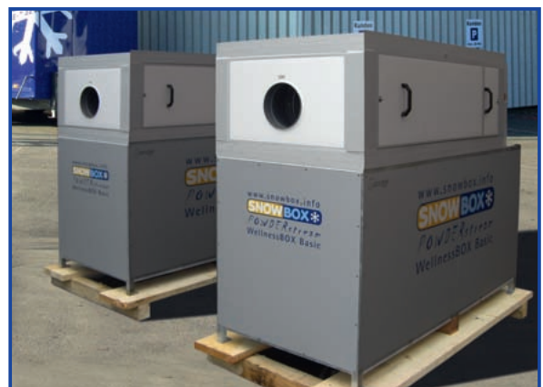
POWDERstream WellnessBOX Basic

Die patentierte, innovative SnowBOX POWDERstream Schneedüse wurde speziell für den Indoor-Einsatz in Skihallen, in Wellnessanlagen und für Industrieanwendungen konzipiert. Schneeräume, bei denen die SnowBOX POWDERstream WellnessBOX für Pulverschnee sorgt, können unabhängig von der Aussentemperatur installiert werden. Die Beschneidung erfolgt bei Raumtemperaturen von -1,5^{\circ}\text{C} bis -6,5^{\circ}\text{C} , die Schneehaltetemperatur beträgt -1,5^{\circ}\text{C} . Die Einstiegsvariante "POWDERstream WellnessBOX Basic" ist für den Einbau in einen bauseits gestellten Schneeraum mit einer Größe von 4-6m 2 konzipiert. Bei größeren Räumen oder bautechnischen Besonderheiten können auf Anfrage individuelle Lösungen angeboten werden.