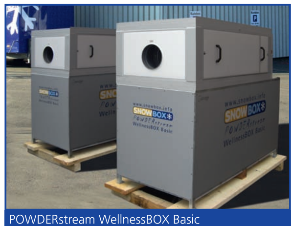
POWDERstream WellnessBOX Basic

Die patentierte, innovative SnowBOX POWDERstream Schneedüse wurde speziell für den Indoor-Einsatz in Skihallen, in Wellnessanlagen und für Industrieanwendungen konzipiert. Schneeräume, bei denen die SnowBOX POWDERstream WellnessBOX für Pulverschnee sorgt, können unabhängig von der Aussentemperatur installiert werden. Die Beschneidung erfolgt bei Raumtemperaturen von -1,5^{\circ}\text{C} bis -6,5^{\circ}\text{C} , die Schneehaltetemperatur beträgt -1,5^{\circ}\text{C} . Die Einstiegsvariante "POWDERstream WellnessBOX Basic" ist für den Einbau in einen bauseits gestellten Schneeraum mit einer Größe von 4-6m 2 konzipiert. Bei größeren Räumen oder bautechnischen Besonderheiten können auf Anfrage individuelle Lösungen angeboten werden.